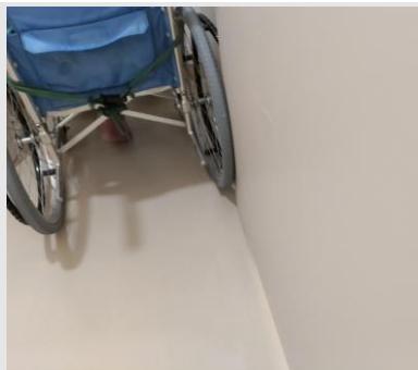
ハンドリムにドアが挟まっているところ