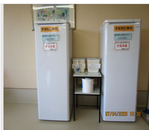
2つのフロアに設置してある患者使用のアイスノン専用の冷凍庫。